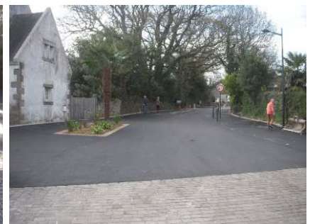
Réception des travaux